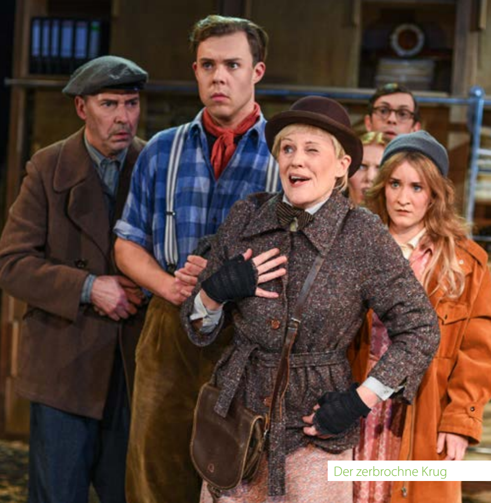
Der zerbrochene Krug